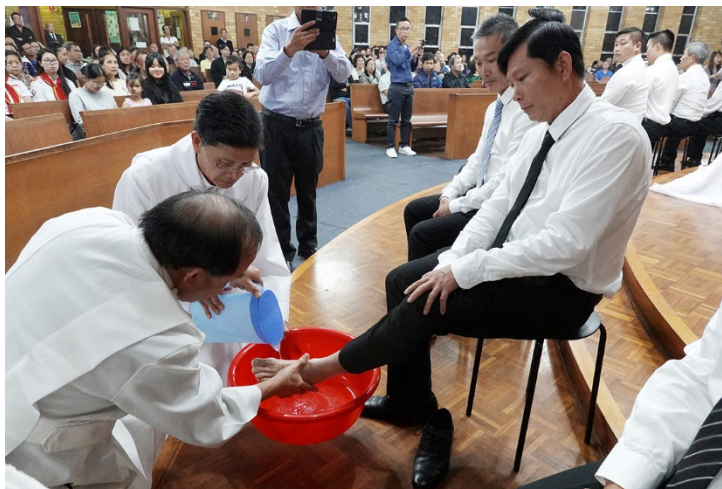
Linh mục Chủ tế rửa chân các Tông đồ giáo dân