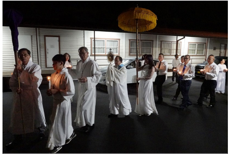
Nghi thức cung nghinh Thánh Thể