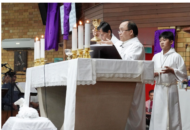
Thánh Lễ Tiệc ly với Nghi thức Rửa chân