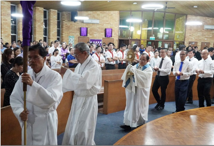
Nghi thức cung nghinh Thánh Thể