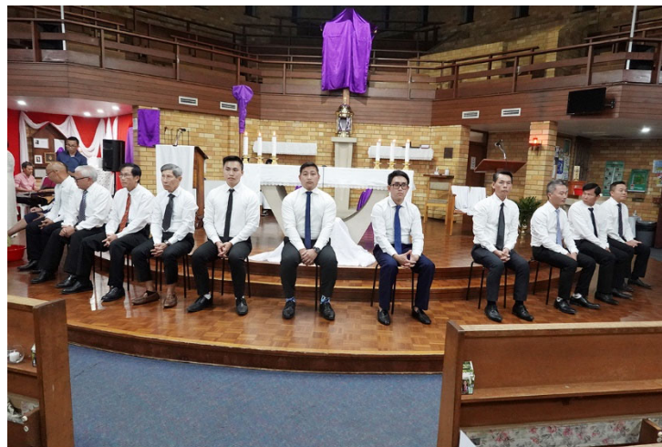
Các Tông đồ Rửa chân