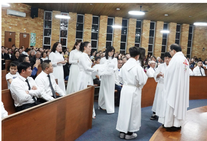
Dâng Lễ Vật