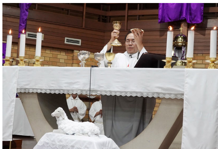
Thánh Lễ Tiệc ly với Nghi thức Rửa chân