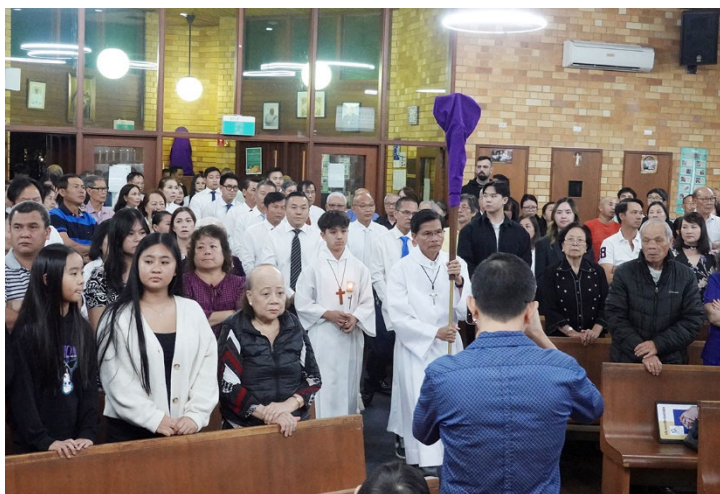
Đoàn Rước Chủ tế cùng các Tông đồ Rửa chân